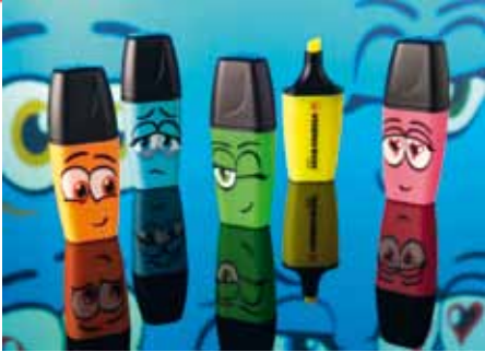
BOSS MINI EYE ♥U