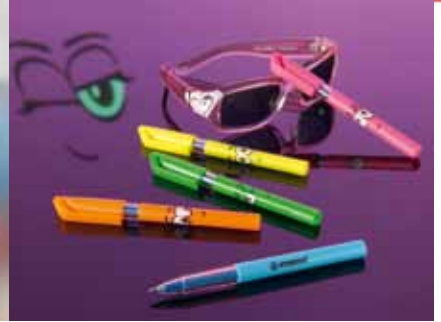
STABILO MINI EYE ♥U