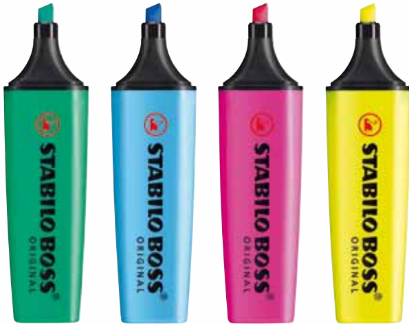
STABILO BOSS ORIGINAL