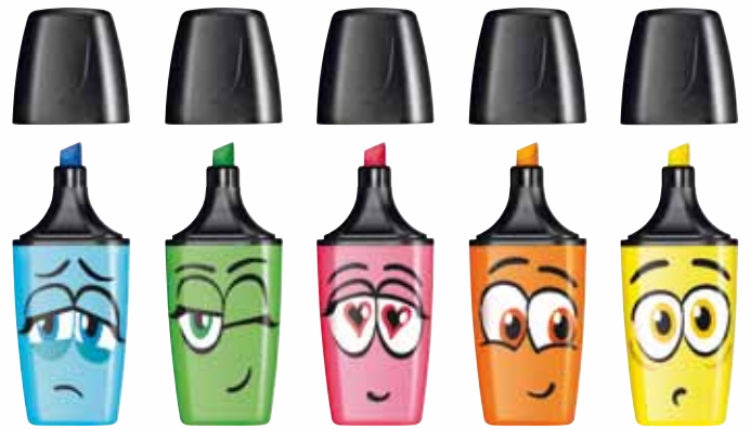
BOSS MINI EYE ♥U