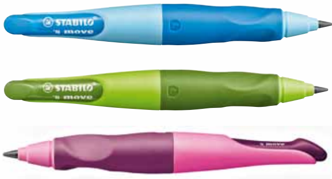
's move easygero